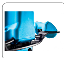
Regulador de velocidad electrónico