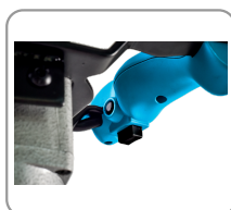
2 modos de velocidad : lenta/rápida