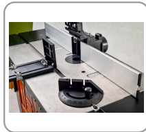
Mesa de acero fundido