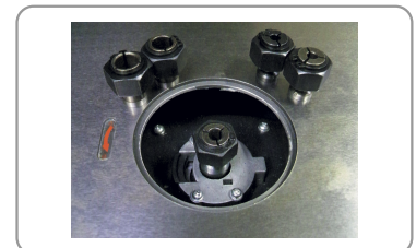
5 pinzas de apriete (6 - 6,35 - 8 - 12 - 12,7 mm)