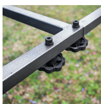
Châssis démontable sans outil