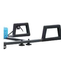
Poignées avec revêtement grip