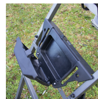
Boîtier de rangement des accessoires