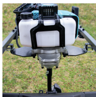
Montage du bloc moteur sur pivots