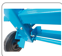
Interverrouillage du chariot de coupe et du protecteur supérieur.