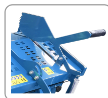
Protecteur supérieur avec poignée réglable et griffe de maintien de la bûche