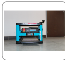
Mesa de cepillado de acero galvanizado.