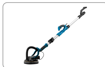
Livré avec une mallette de rangement