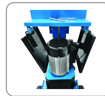
Plateaux d'alimentation repliables