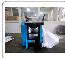
Sistema de aspiración integrado (con bolsa de recogida de virutas)