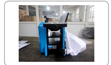
Sistema de aspiración integrado (con bolsa de recogida de virutas)