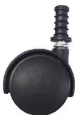
Rueda direccional (1 pieza)