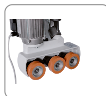
3 rodillos \varnothing 80 mm