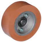
Rodillo de goma Ø 80 mm