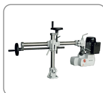
Brazo prolongado de 610 mm