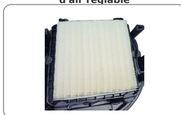
Décolmatage automatique par impulsions