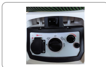
Prise synchronisée pour appareil électroportatif, débit d'air réglable