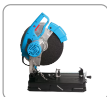
Grande poignée ergonomique en d.