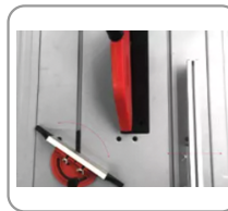
Guide d'angle réglable à 45°.