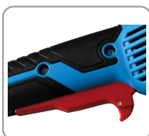
Gâchette de démarrage avec bouton de déverrouillage.