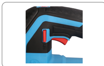
Gâchette de démarrage avec bouton de déverrouillage.