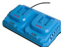
Chargeur rapide double batterie 20V Li-Ion