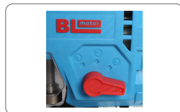
Mouvement pendulaire à 4 positions.