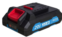
Chargeur rapide de batterie 20V Li-Ion