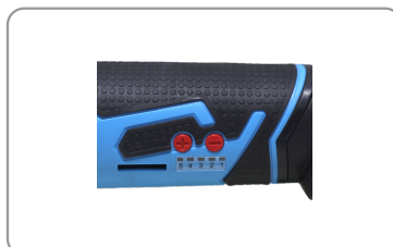
5 vitesses programmées.