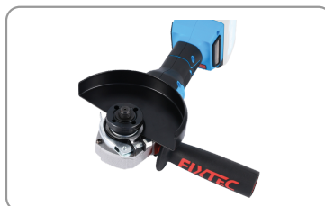
Témoin de charge.