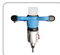
Poignées de préhension ergonomiques.