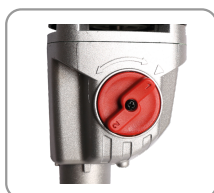
2 plages de vitesses mécaniques.