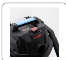
2 vitesses d'aspiration + fonction souffleur.