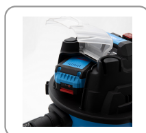
Compartiment à batterie.