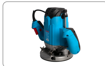
Base en aluminium avec patin de glisse.