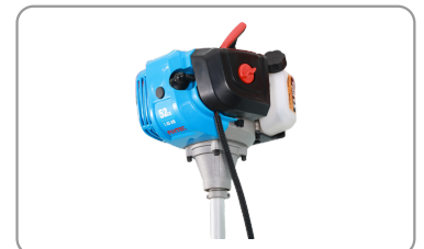
Moteur thermique 2 temps de 52 cm.