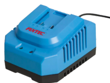
Chargeur rapide de batterie 20V Li-Ion.