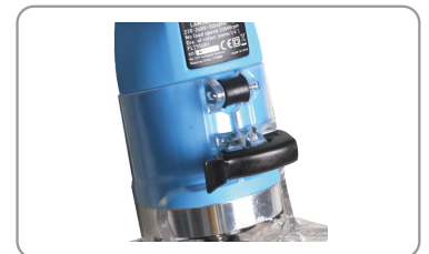
Butée de profondeur réglable.