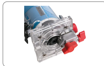
Guide de copiage.