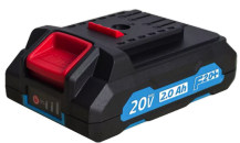
Batterie 20V Li-Ion 2.0 Ah