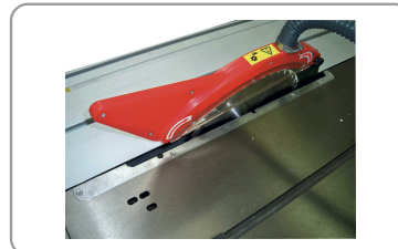
Carro junto a la hoja de 2000 mm