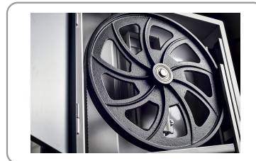
Volantes de acero fundido equilibrados