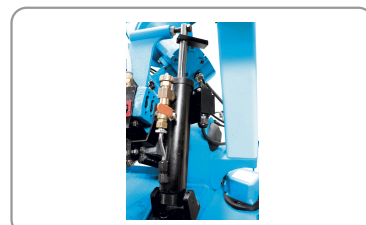
Descenso del arco mediante, cilindro hidráulico con regulación de la velocidad de bajada del cabezal