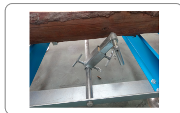
Sistema de retención de troncos