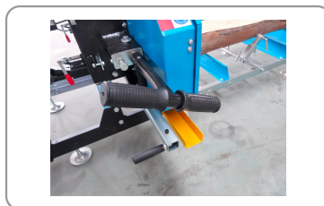
Mango de ajuste de la tensión de la cuchilla