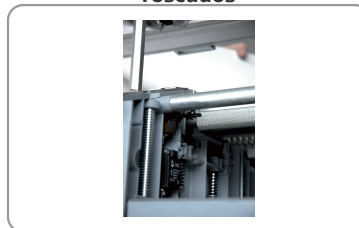
Contactor de seguridad