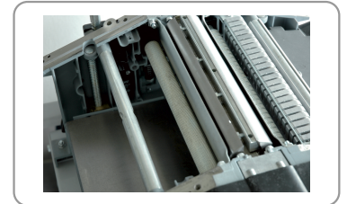
Rodillos de alimentación para el avance de la pieza de madera