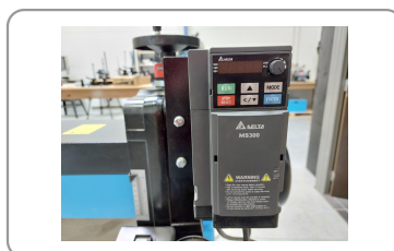
Onduleur delta permettant de régler la vitesse de rotation du cylindre