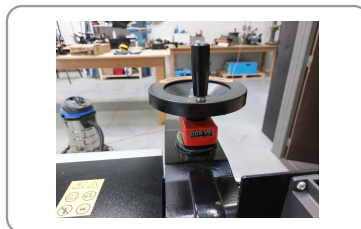
Réglage de la hauteur avec compteur à lecture directe