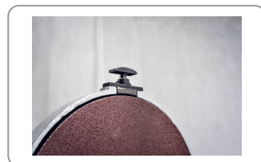
Freno de disco