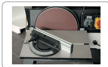
Guía de inglete