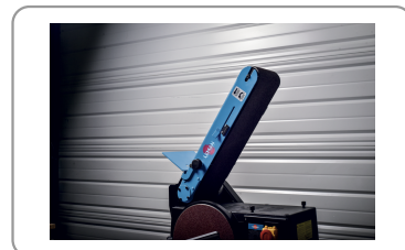
Banda orientable de 0° a 90°