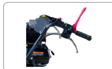
Poignée de sécurité "homme mort"