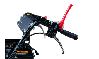
Poignée de sécurité "homme mort"