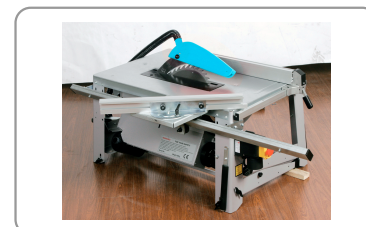
Piètement repliable sans outil.