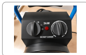
Fonction ventilation seule