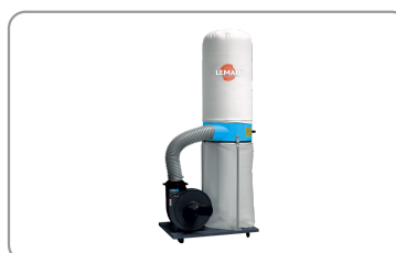
Bolsa de filtración de fieltro