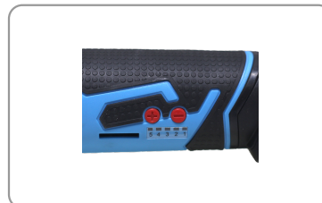
5 vitesses programmées.