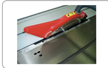
2000 mm sliding carriage flush with the blade