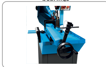
Quick clamping vice with slack adjustment lever