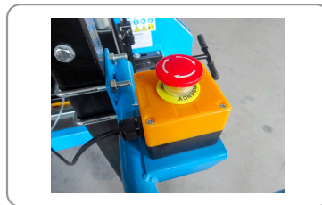
Emergency stop button