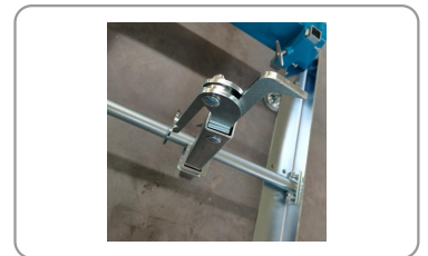
Griffe de maintien à serrage excentrique