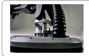
Pivoting sanding head