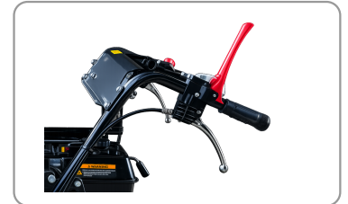
Poignée de sécurité "homme mort"