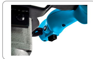
2 speed modes : slow/fast