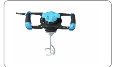
Poignées ergonomiques avec revêtement soft-grip.