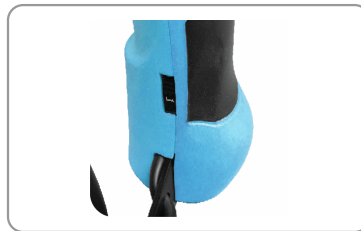
Molette de réglage.