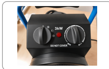
Fonction ventilation seule