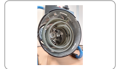
2 résistances indépendantes de 1500w chacune