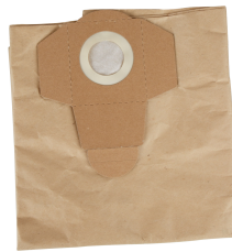
Sac filtre en papier (lot de 5 pièces)