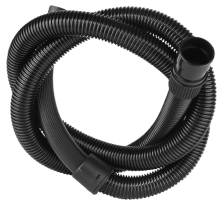
Tuyau flexible d'aspiration (4m)