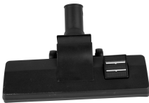
Suceur mixte eau et poussière (Ø32mm)