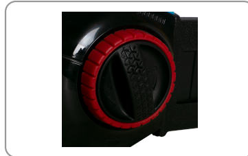
Blocage du guide et tendeur de chaîne.