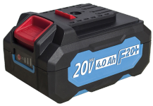
Batterie 20V Li-Ion 4.0 Ah