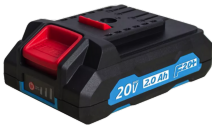
Batterie 20V Li-Ion 2.0 Ah