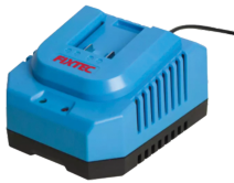
Chargeur rapide de batterie 20V Li-Ion