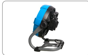
2 vitesses de ventilation réglables.