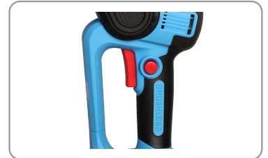
Compacte, légère, pratique et maniable.