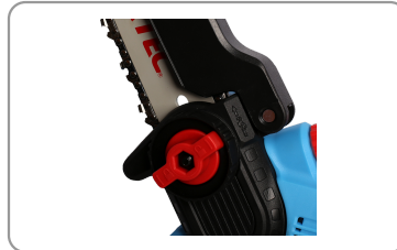
Changement de lame rapide et facile.